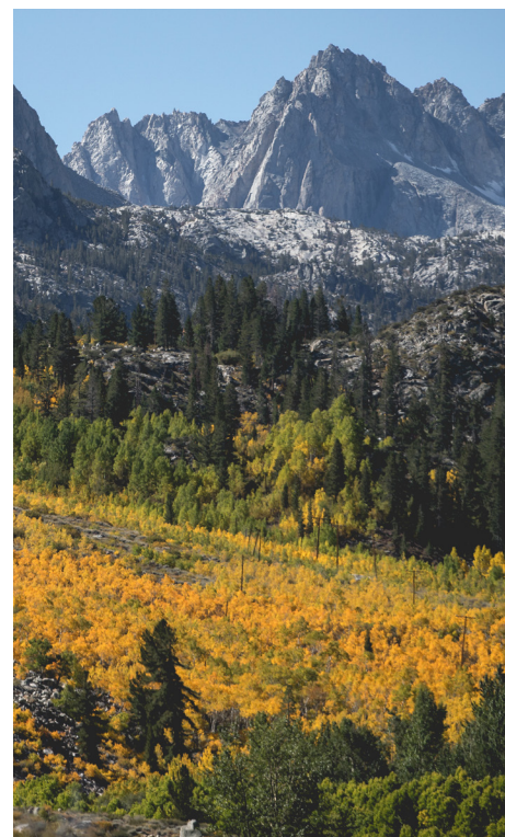
Bishop Creek Canyon, Californie

Aujourd'hui, nous visiterons le célèbre parc américain, Yosemite. Avec ses hauts sommets de granit et sa fabuleuse vallée de Yosemite, cette route pittoresque vous