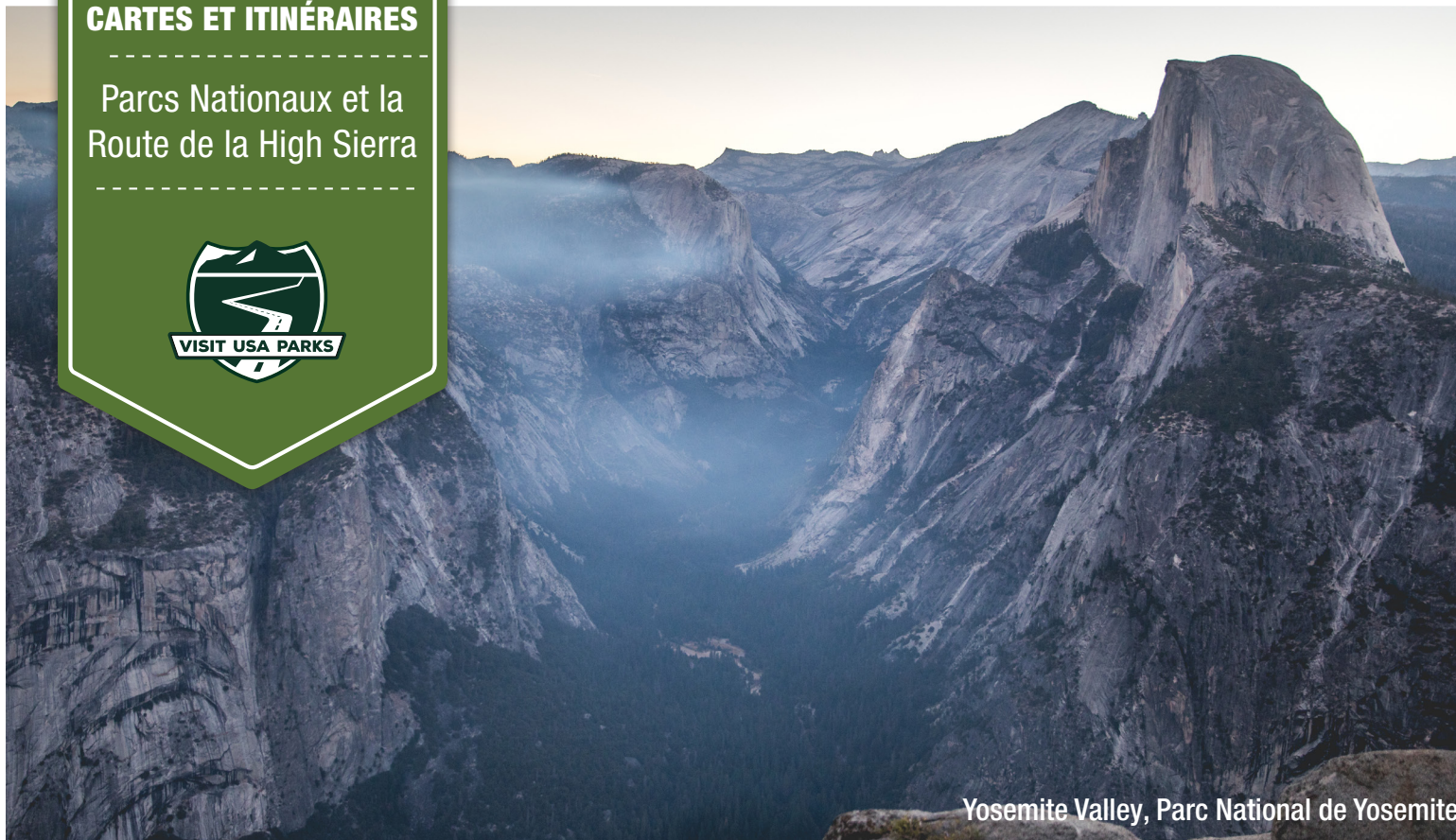
Yosemite Valley, Parc National de Yosemite