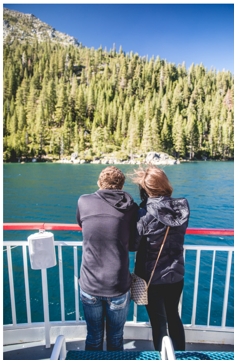
Emerald Bay, Lake Tahoe

De retour à terre, il vous tarde vraiment de vous y retrouver. Le Emerald Bay State Park se trouve à 45 minutes de route du Zephyr