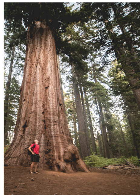
Calaveras Big Trees State Park