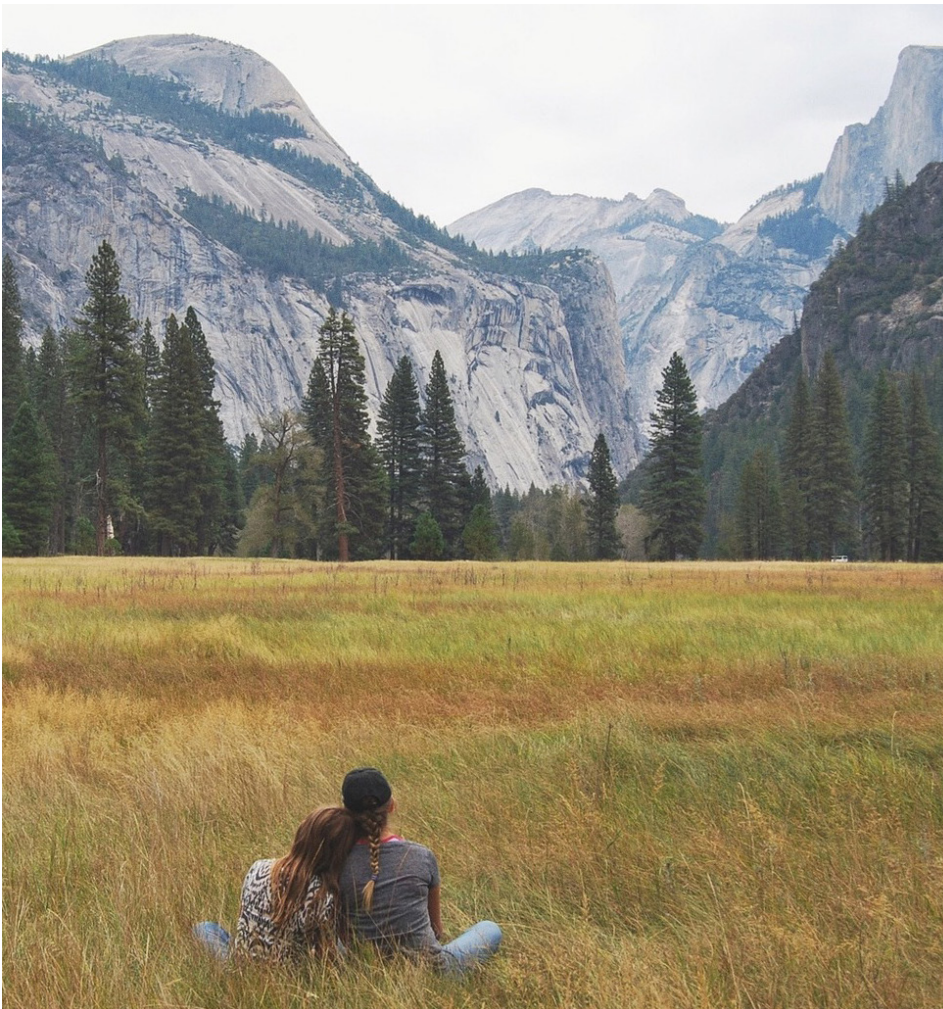
Vue de la Yosemite Valley le long de la rivière Merced à Valley View, Parc National de Yosemite

l'éon, nous vous encourageons à revenir à Whoa Nellie Deli pour le déjeuner. (Oui, c'est tellement bon!)