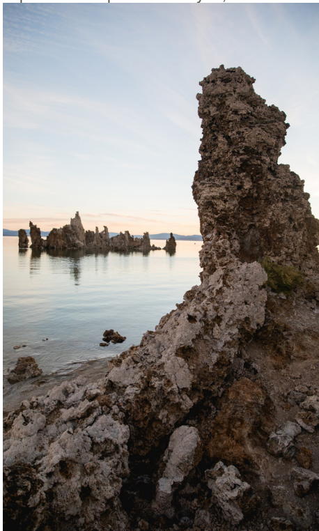
South Tufa, Mono Lake, Californie

Après avoir fait le plein d’énergie matinale, explorez Bishop Creek Canyon, situé à 20