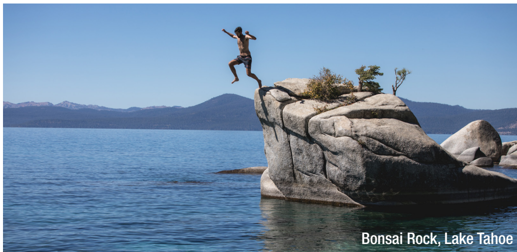
Bonsai Rock, Lake Tahoe

Cet itinéraire montre les expériences incroyables que vous pouvez vivre lors de voyages en Californie et la région de la High Sierra du Nevada. La High Sierra est réputée pour sa silhouette magnifique et ses paysages spectaculaires, ce qui en fait l'une des plus belles caractéristiques des États-Unis. Biologiquement, la région abrite les plus gros arbres du monde - les séquoias géants. Ce road trip vous emmène au milieu de la High Sierra et commence et se termine à Reno, dans le Nevada. La route vous mènera à travers deux parcs nationaux, plusieurs state parks et centres-villes, ainsi qu'une petite histoire d'Americana. Sur cette route, vous pourrez manger dans divers restaurants, séjourner dans des hôtels éclectiques et visiter quelques-unes des régions sauvages les plus impressionnantes des États-Unis.