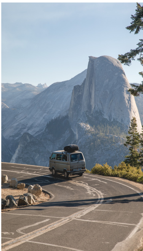
Glacier Point Road, Parc National de Yosemite