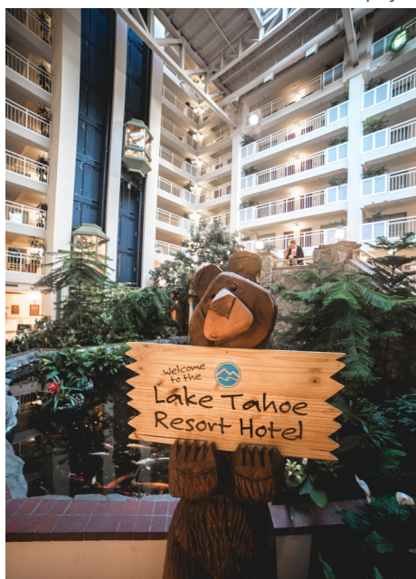
Lake Tahoe Resort Hotel, Lake Tahoe

Le Groveland Hotel se trouve à une heure de Calaveras. Cet hôtel historique est situé à Tuolumne, près de Yosemite. Faites-vous enregistrer à la réception et préparez-vous pour le dîner. Il existe de nombreuses possibilités dans la région, mais nous recommandons l'Iron Door Saloon, le plus ancien saloon fonctionnant sans interruption en Californie.