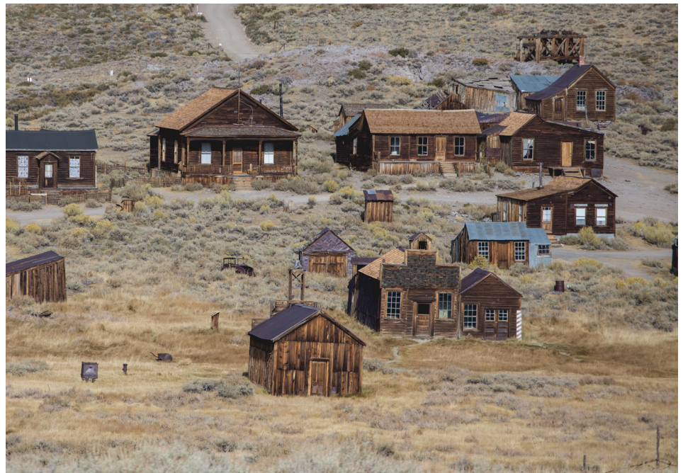
Bodie State Historical Park, Bodie, Californie

minutes de route du centre-ville de Bishop. Air frais, pics de granit, lacs immaculés et fleurs sauvages d’été. C’est un endroit idéal pour faire une pause après tout ce temps passé sur la route.